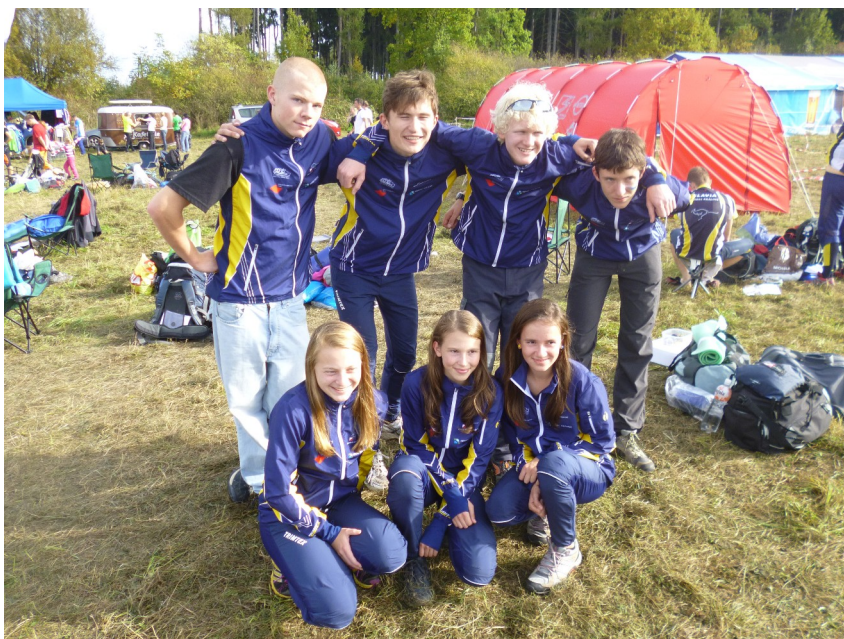
Dorostenci na MČR klubů, 12. 10. 2014

V roce 2020 přišla pandemie Covidu-19, která na dva roky velmi zasáhla celou společnost, tedy i sportovní přípravu a závodění. Naši trenéři se však snažili v rámci aktuálních omezení po celou dobu připravovat pro mládež tréninkové příležitosti. Do této nepříznivé doby bohužel přišla i diskuze o změně vizuální identity, často zúžená na to, co se předešlá léta neřešilo: Totiž jestli budeme mít nové dresy a overaly nebo ne. Nakonec je máme, opustili jsme klokana, měli jsme se propagovat jen jako OK Slavia, máme novou grafiku map. Rozpory vyhlazuje čas, i když řada veteránů se nejspíš už do nového nepřevlékne.