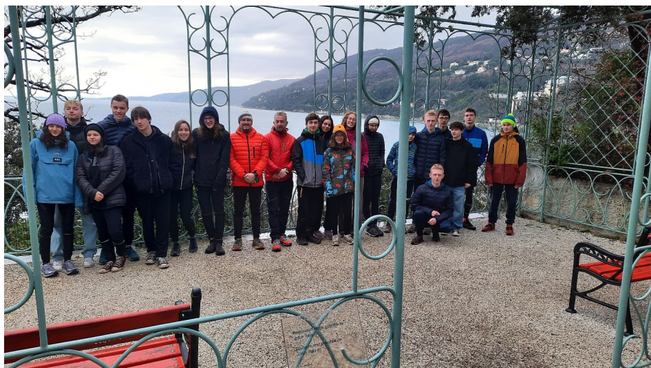
Mapové soustředění dorostu ve Slovinsku + Lipica Open, 9. 3. 2024

Příprava přístavby šatnového objektu (výhledově plánovaná od samého počátku) se začala řešit již v roce 2016, ale po významné změně vedení klubu příprava nepokračovala a obnovena byla až po roce 2020. Výsledkem pak byl projekt a získání (a prodloužení) stavebního povolení. Opět se ukázalo, že náhoda přeje připraveným: Díky příznání nezvykle vysoké dotace od města začala výstavba v červenci 2024 s očekávaným dokončením v následující stavební sezoně.