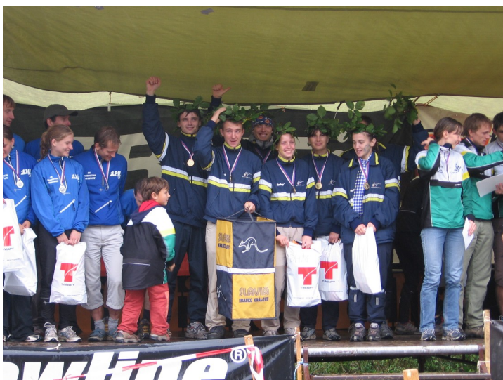
Vítězství na MČR klubů, 1. 10. 2006