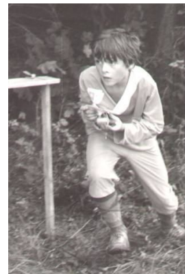
KP Výšinka 1985