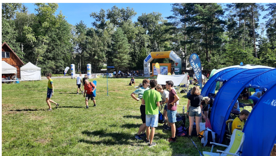
Momentka z pořádání Českého poháru a Žebříčku A, Koliba, 9. 9. 2023