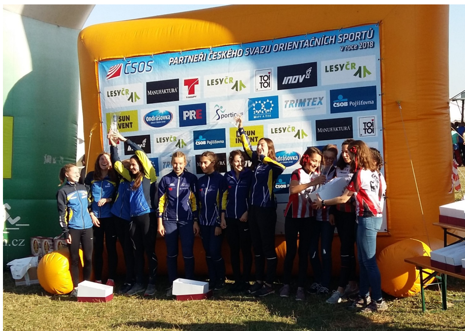
Celkové vítězství dorostenek v Českém poháru štafet, 14. 10. 2018