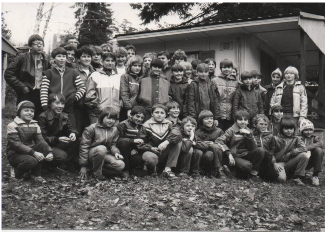
Dole: Velikonoce Jevany 1986