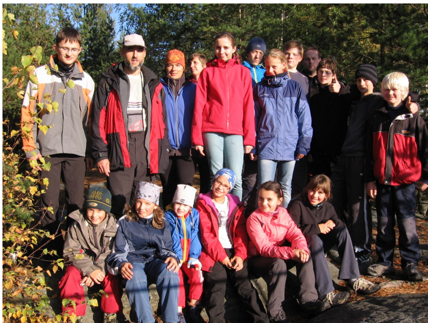
Zakončení žactva, Teplice, 28. 10. 2011

Začátek druhého desetiletí oddíl postavil před velký úkol spolupřátání Mistrovství světa juniorů 2013, kterého se zhostil velmi dobře. O rok později jsme ve Smiřicích byli průkopníky tehdy nové disciplíny a uspořádali vůbec první MČR sprintových štafet. Na začátku roku 2013 byl spuštěn svazový informační systém ORIS, který velmi změnil přihlašování na závody a soustředil na jednom místě informace o nich včetně výsledků.